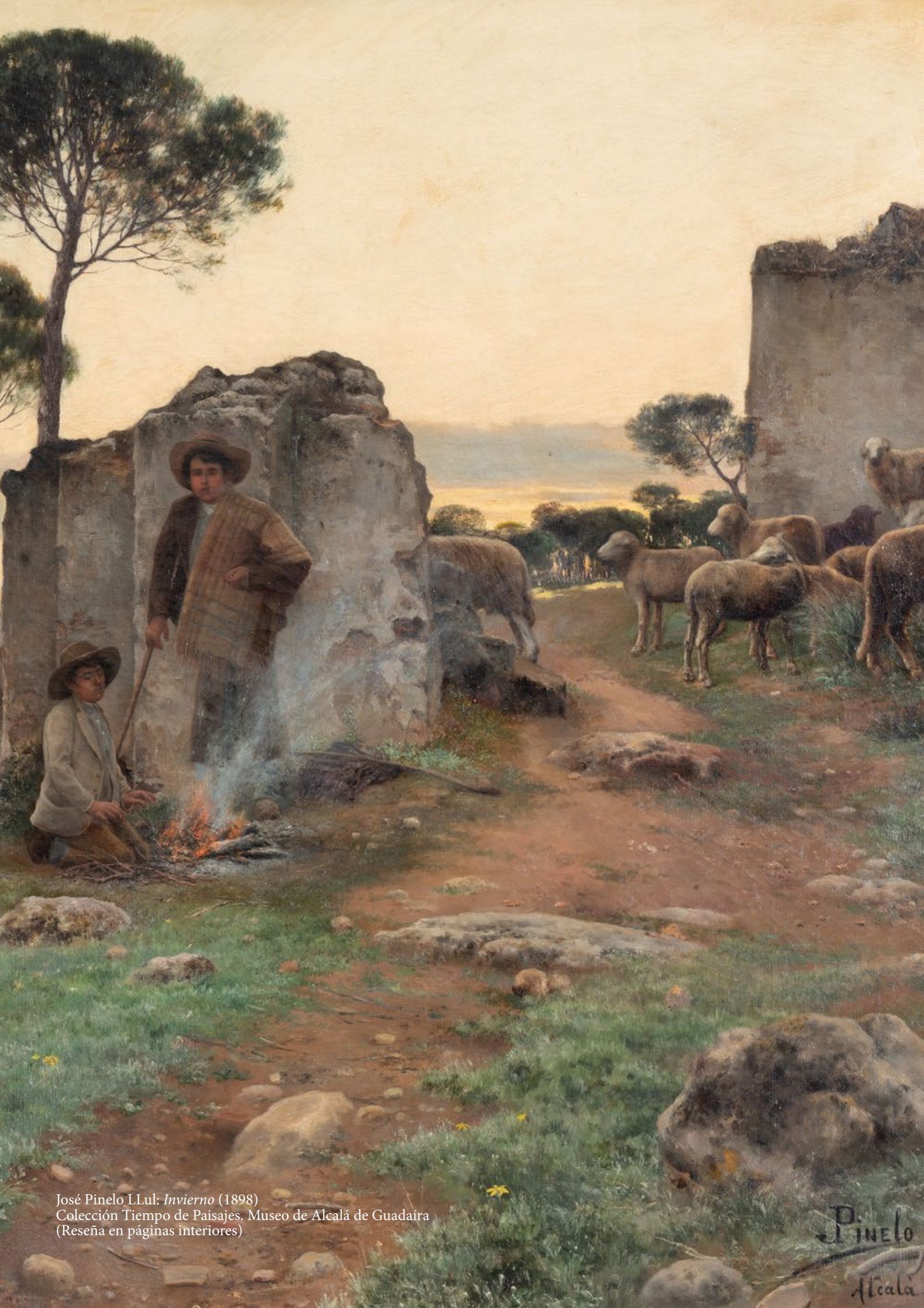
José Pinelo LLul: Invierno (1898) Colección Tiempo de Paisajes. Museo de Alcalá de Guadaíra (Reseña en páginas interiores)