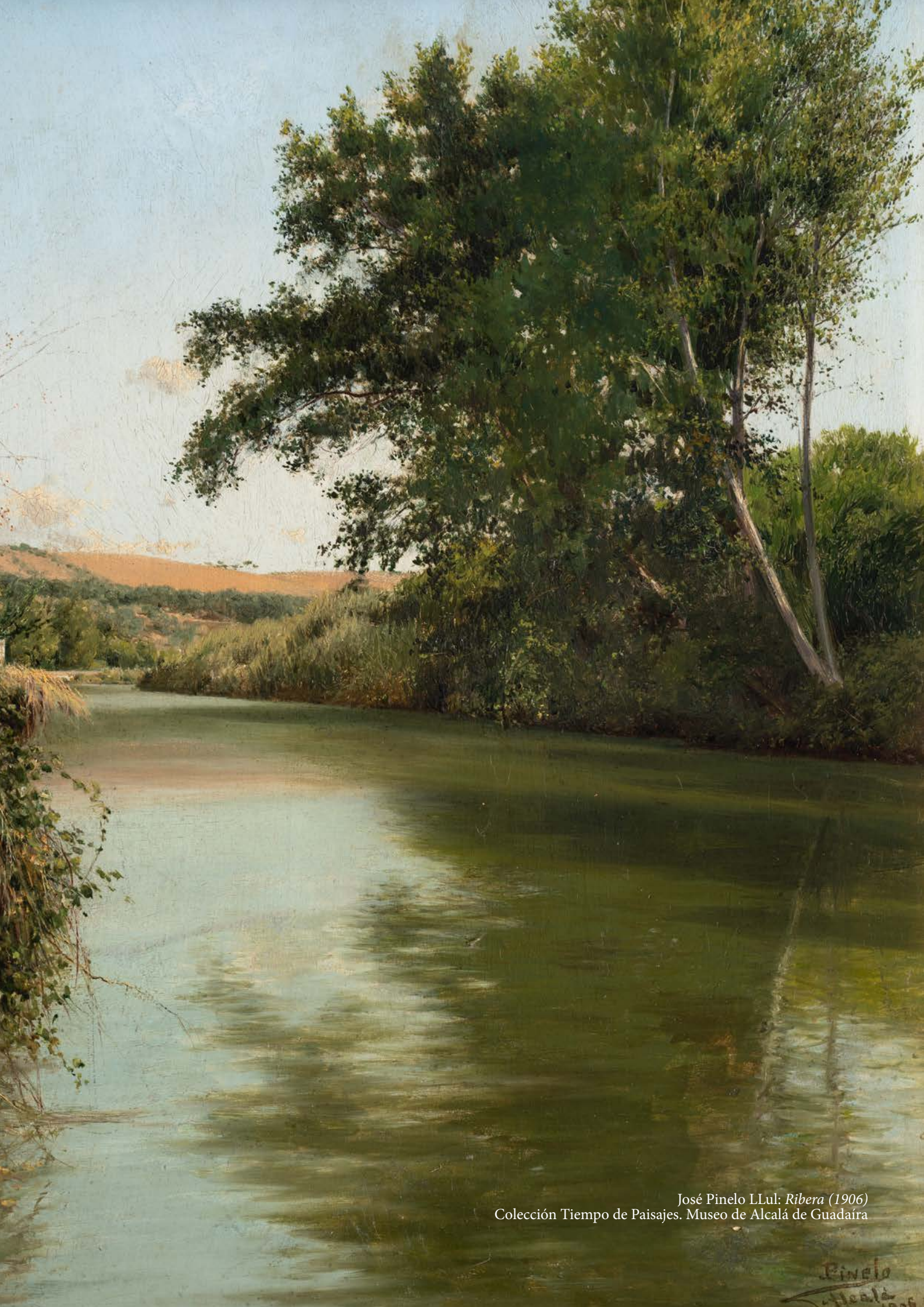
José Pinelo LLul: Ribera (1906) Colección Tiempo de Paisajes. Museo de Alcalá de Guadaíra